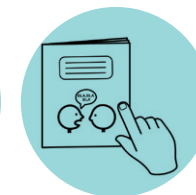
Cuaderno de imágenes