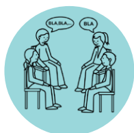
Comprensión en conversaciones