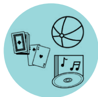
Actividades para estar centrado