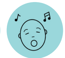
Fomentar lenguaje oral