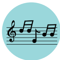
Música de canciones conocidas

También existen programas informáticos de descarga gratuita y páginas web que pueden resultar muy útiles: