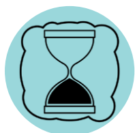
Más tiempo para comunicar