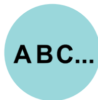
Letras y números