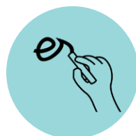
Estimular cualquier tipo de comunicación